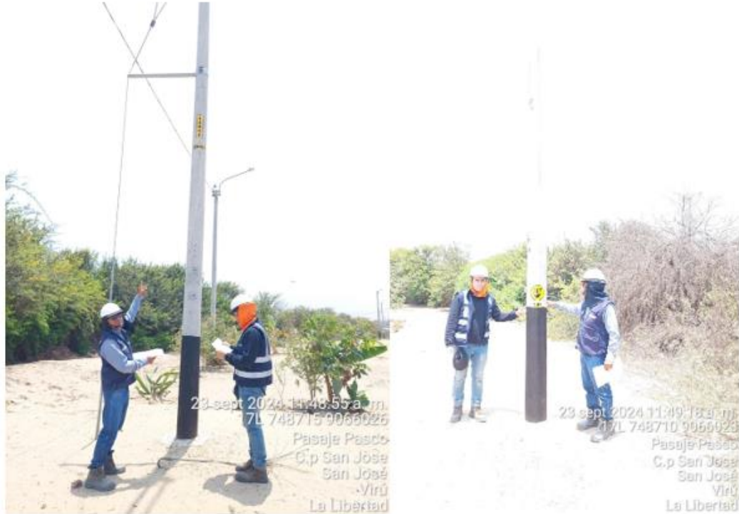
FOTO N° 01: VERIFICACIÓN DE CODIFICACIÓN DE POSTES DE RED SECUNDARIA Y SEÑALIZACIÓN DE PUESTA A TIERRA.